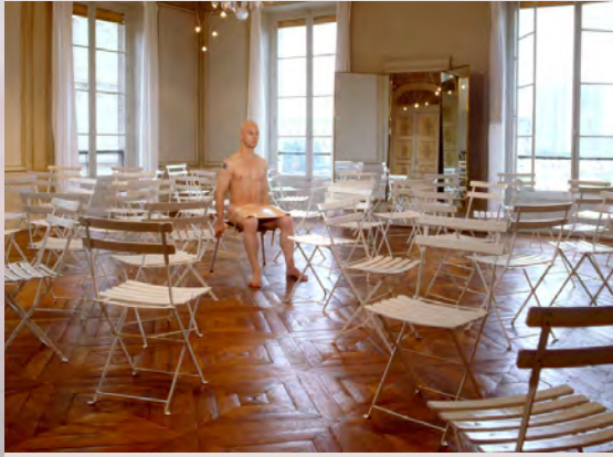
- Made In Eric -